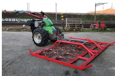
Accessoire trainé Grâce à la conception structurelle de la herse de prairie, il est facile de travailler en marche avant.