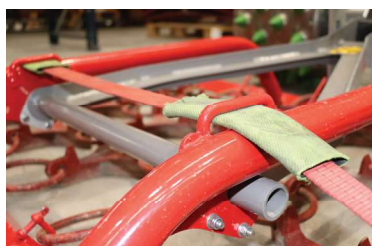
Soulever, charger, fixer Les œillets de levage et les pattes pour l'enfilage des sangles facilitent la fixation et l'arrimage fiable de la charge.