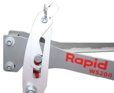
En position de transport ou de chargement, herse de prairie bloquée