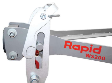
En position de travail, herse de prairie en position flottante