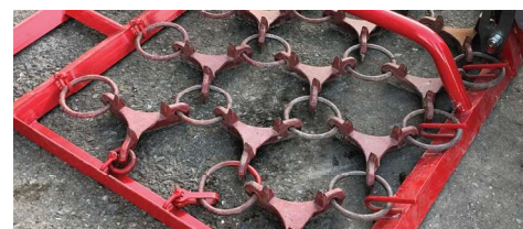
Étoiles avec tiges et pointes, utilisation des deux côtés

Le filet est composé d'anneaux et d'étoiles et représente le cœur et l'outil principal de travail de la herse de prairie. Les étoiles sont de formes différentes et ont des tiges simples d'un côté pour un traitement en douceur. De l'autre côté, des pointes sont disposées pour permettre un traitement intensif. Le filet peut être déposé et retourné en quelques gestes.