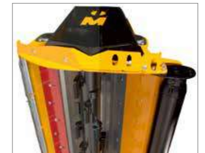
Pour une longue durée de vie : intercalaires anti-usure remplaçables et patins d'usure en carbure.