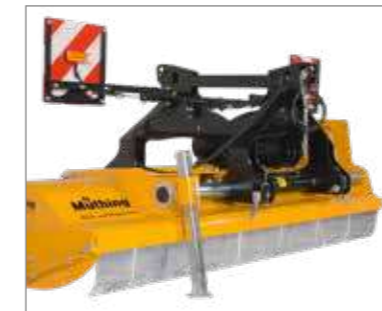
Attelage frontal ou arrière robuste avec déport latéral hydraulique (course de déplacement de 56 cm).