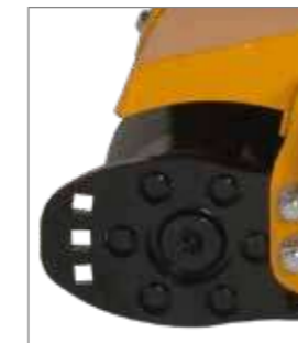
Paliers du rouleau d'appui Starinth®.