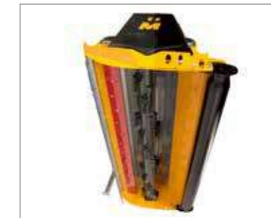
Le MU-Vario® se caractérise par une forme optimisée de l'admission et du carter, et un degré de broyage et de défibrage à réglage progressif. Pour une qualité de broyage et de défibrage idéale.