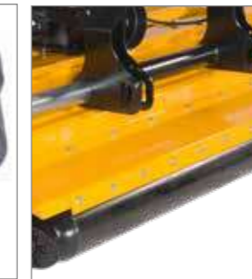
Le racleur maintient le rouleau d'appui propre et réduit la formation de poussière (en option).