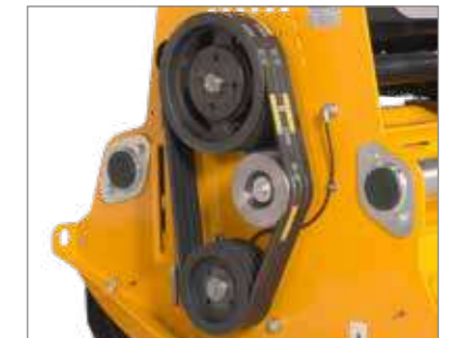
Travail sans encombre et nécessitant peu d'entretien grâce au tendeur automatique de courroie.