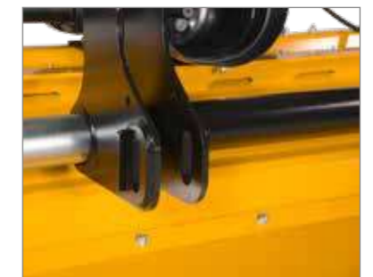
Parfait suivi des reliefs du terrain grâce aux trous oblongs Cat .2 sur les points de montage des bras supérieur et inférieur ainsi qu'au rouleau d'appui orientable.