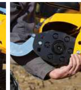
Réglage facile du rouleau d'appui orientable même sans aide supplémentaire.