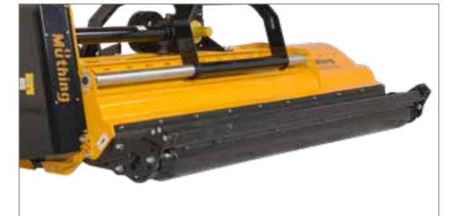
Avec deux plaques d'adaptation remarquablement stables, la dépose des résidus est également possible devant le rouleau d'appui (en option).