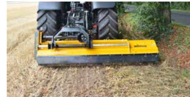
Déport latéral hydraulique : broyage déporté à côté du tracteur pour plus de flexibilité autour des arbres, des entrées ou autres obstacles (en option).

Le MU-Vario® se caractérise par une forme optimisée de l'admission et du carter, et un degré de broyage et de défibrage à réglage progressif. Pour une qualité de broyage et de défibrage idéale.