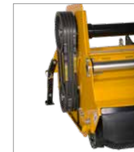
Vitesse de rotation de l'arbre de prise de force de 540 ou 1.000 tr/min possible sur les MU-L Vario 180-250.