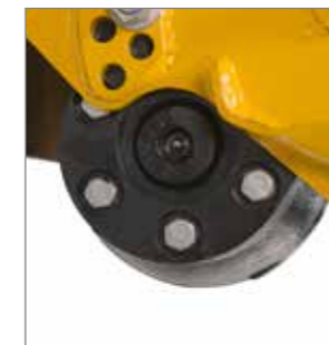
Paliers du rouleau d'appui Starinth®.