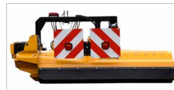
Plaques de signalisation pivotantes avec dispositifs d'éclairage LED et supports d'éclairage à fixation robuste sans éléments mobiles