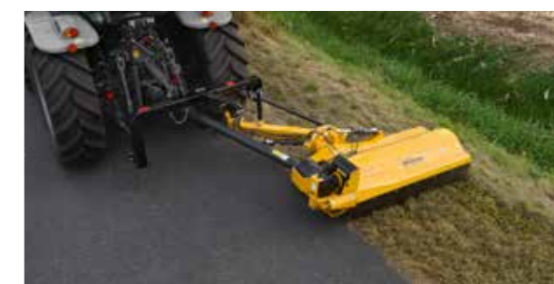
Beaucoup de place pour le montage sur le tracteur et l'arbre de transmission suiveur de mouvement.