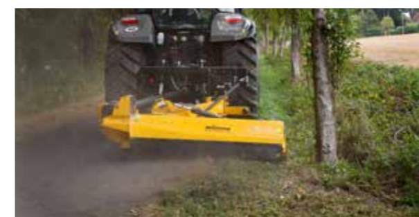
Une grande zone de portée permet de travailler tant à l'arrière que sur le côté du tracteur. Permet d'intervenir sur les voies d'accès étroites comme sur les accotements.