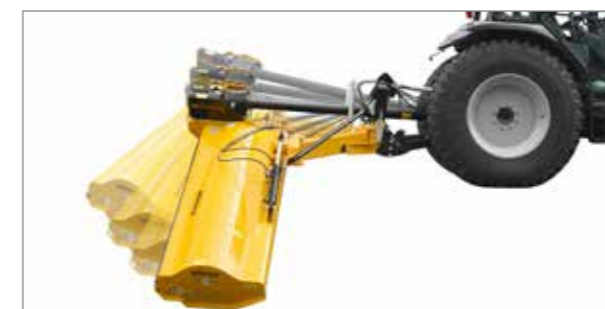
La sécurité anti-collision mécanique brevetée se déclenche de manière fiable et revient d'elle-même en position de travail.