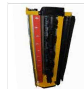
Le MU-Vario® se caractérise par une forme optimisée de l'admission et du carter, et un degré de broyage et de défibrage à réglage progressif. Pour une qualité de broyage et de défibrage idéale.