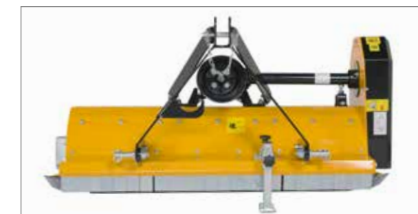
Le MU-C pour montage arrière : tête d'attelage Cat. 1 et un boîtier surélevé (vitesse monorapport de 540 ou 1.000 tr/min).