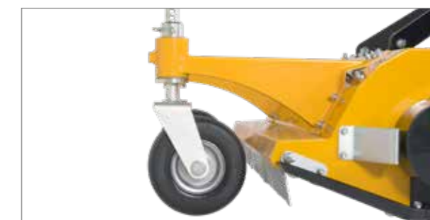
Des roues de support stables pour la montée à l'avant facilitent la manipulation et améliorent le suivi du sol (en option). Elles sont réglables en hauteur et pivotantes à 360°.