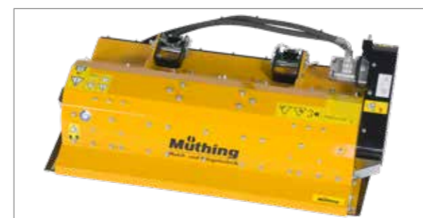
Transmission hydraulique du MU-C Hydro pour le montage frontal sur véhicules spéciaux.