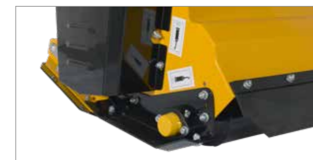
Rouleau palpeur réglable finement gradué pour le guidage en profondeur.