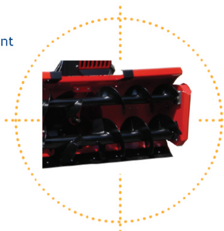
Double vis diamètre 352/500 mm