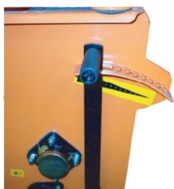
Réglage du fond à ressorts

Particularité : des attelages spécifiques sont disponibles pour les tracteurs suivants : Cararo Rondo - Iseki SF 230/330 - Vitra series - John Deere Gator - Ventrac - Shibaura CM 214/284/364 - New Holland MC 28/35 - Nimos 202-501