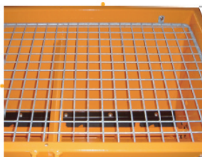
Grille de protection