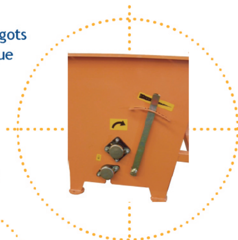
Réglage du fond à ressorts