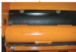
Ergots interchangeables et fond caoutchouc