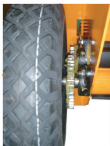
Rouleau épandeur entraîné par les roues